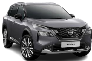
Szary - KAD