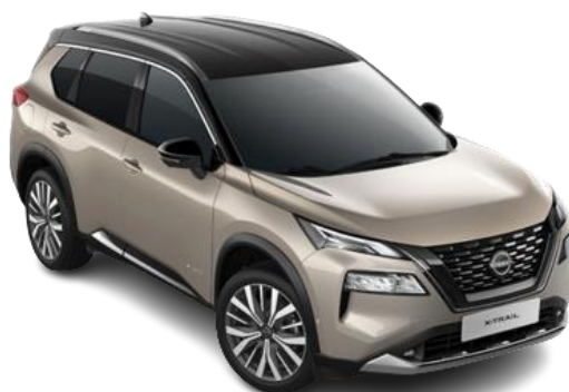
Szampański + Czarny dach - XEW