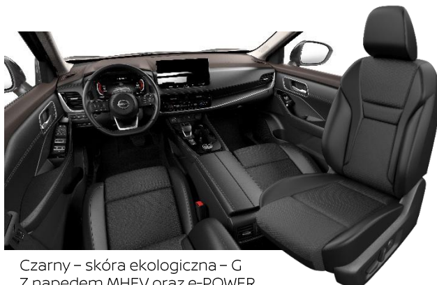
Czarny - skóra ekologiczna - G Z napędem MHEV oraz e-POWER