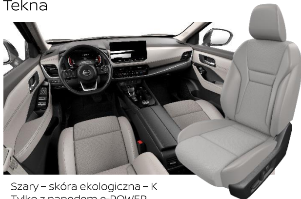
Szary - skóra ekologiczna - K Tylko z napędem e-POWER