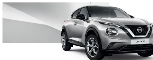
Srebrny - KYO