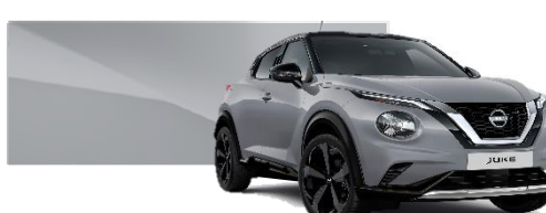
Szary ceramiczny - KBY