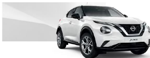
Biały - 326

Lakier metalizowany / premium – 2.400 zł