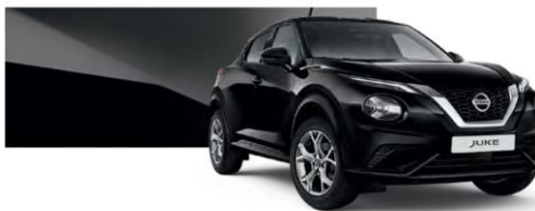
Czarny - Z11