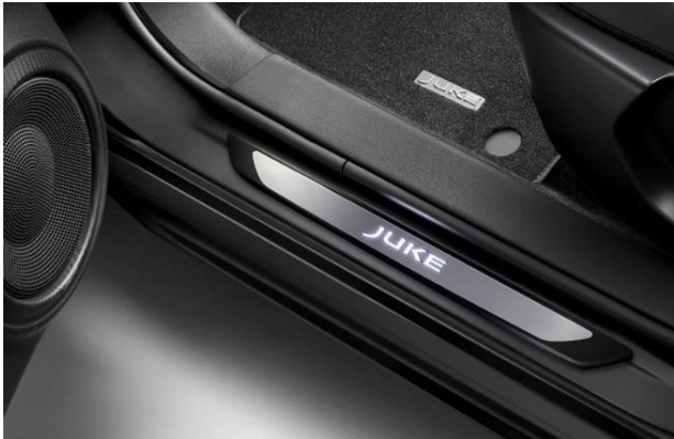
Podświetlane nakładki progów