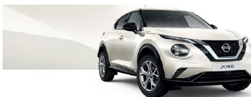
Biały perłowy - QAB