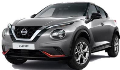
Miejski pakiet pomarańczowy