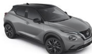
Szary ceramiczny + Czarny dach - XFU Personalizacja wnętrza N-Design: B

Dostępne 3 opcje personalizacji wnętrza dla wersji N-Design: